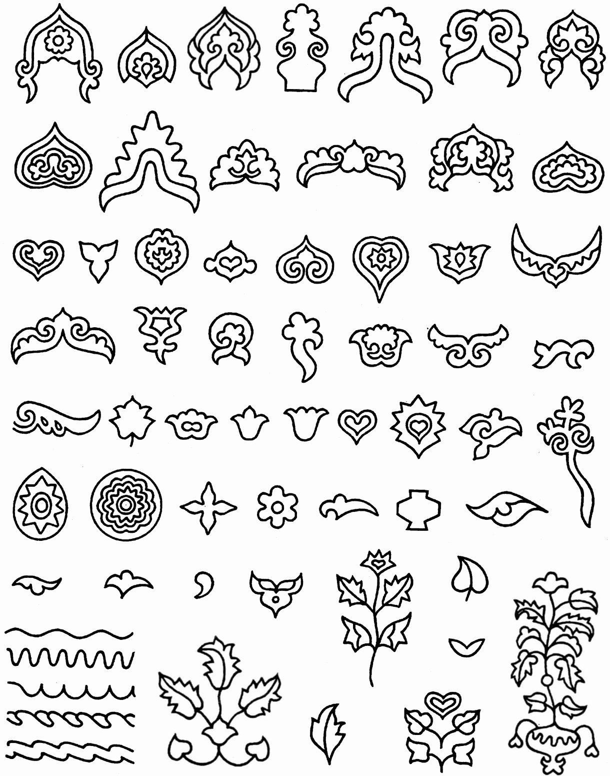
Таблица 24. Мотивы цветочного характера в узорной обуви. Вторая половина XIX в.